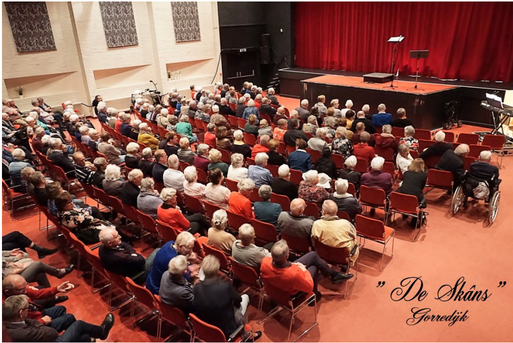
"De Skåns" Gorredijk