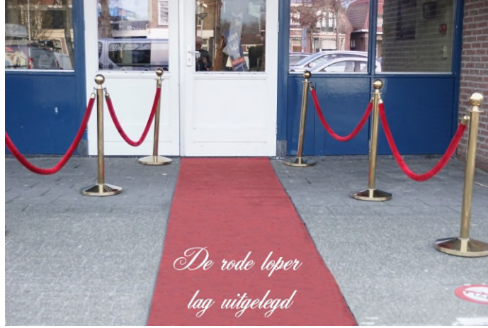
De rode loper lag uitgelegd