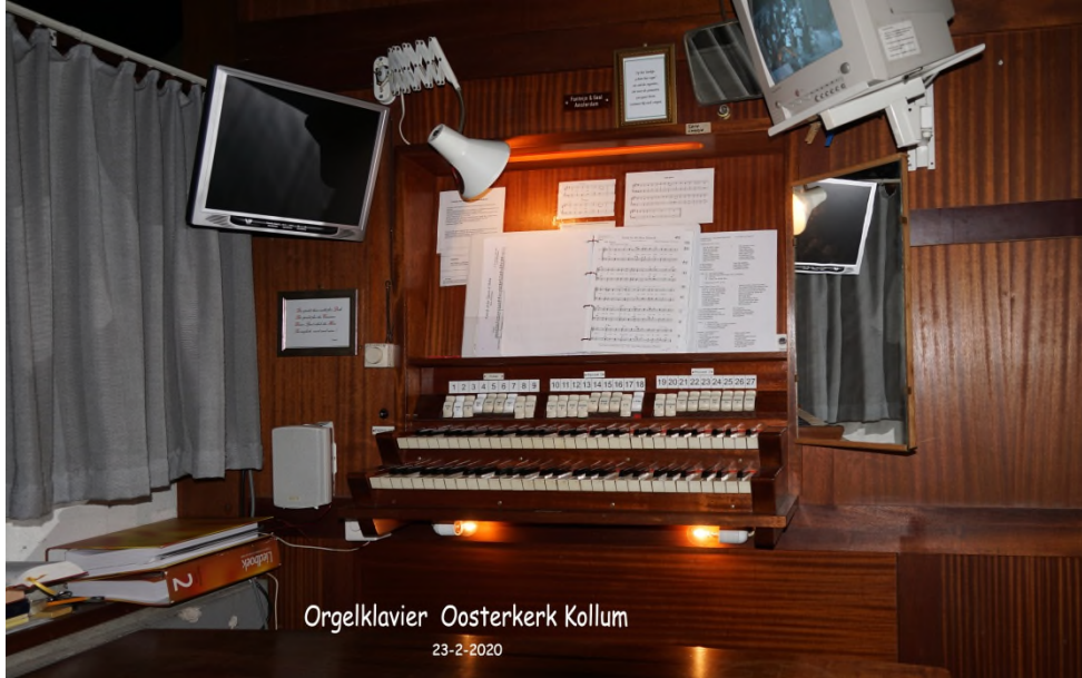
Orgelklavier Oosterkerk Kollum 23-2-2020